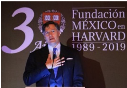
Embajador Christopher Landau